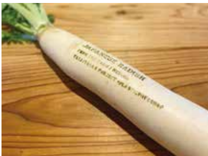
野菜の直接印字は、画期的で「脱プラスチック」を考えるきっかけに

このご縁で白石農園さん（大泉町）と知り合い、私が常日頃から考えていた野菜直売所で「脱プラスチック販売」