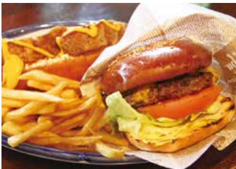
新商品「フィリッポバーガー」の試作

同業者同士であっても、互いに助け合っていくことがより一層大切になると考えています。