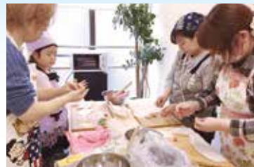
平成27年12月に始めた和スイーツ教室(平和台店)も評判です

今は、いちご大福をヒントに、赤をコンセプトにしたブランド「Benia」を展開中です。「ショートケーキと合わせたら面白そう」など、パズルのように組み合わせを考えるのは、わくわくして楽しいですね!