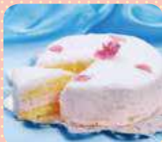
大泉さくらケーキ