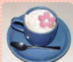
学園通りさくらコーヒー