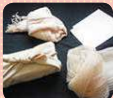
学園桜染シリーズ