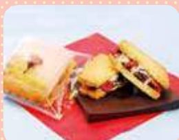
大泉学園のサクラさん