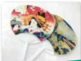
うちわへの活用例