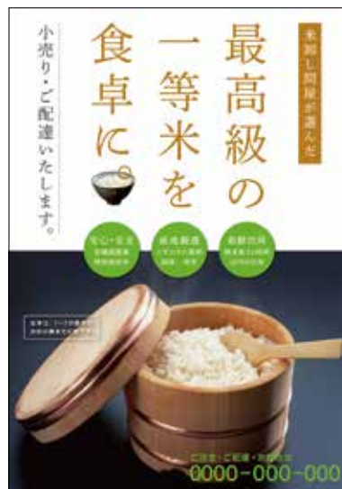
一般小売りターゲット用