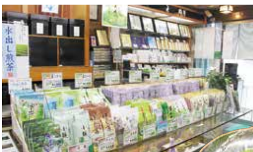
商品を陳列した店内