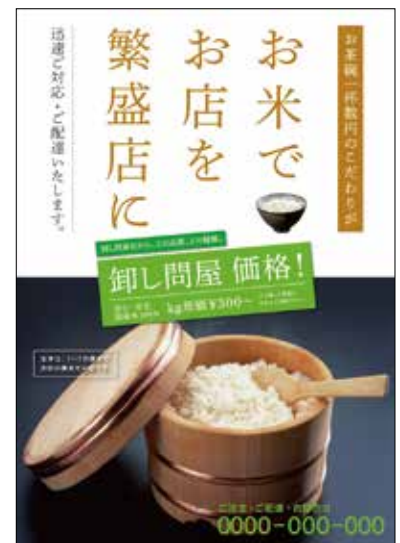
飲食店などの卸売りターゲット用