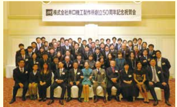
創立50周年記念祝賀会にて