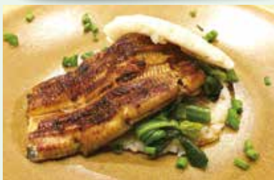
「鰻ライスバーガー」1,500円(税別)は、カジュアルに鰻を楽しめるメニュー♪