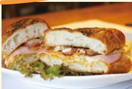
ガーリックバターで表面をカリッと焼いたキューバサンド。テイクアウトやデリバリーもオススメ!(1,150円)