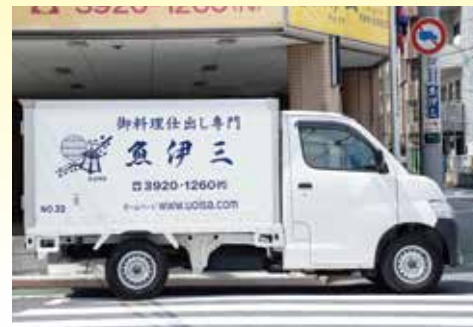
仕出し配達用の車は20台あります