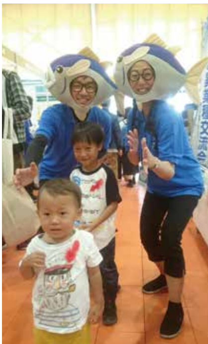
産業見本市の様子。魚の被り物は、子どもたちに人気！

“コロナウイルスを広めない”という社会貢献活動が新たな活路を見出し、さらには社員のモチベーションアップにつながったのです。