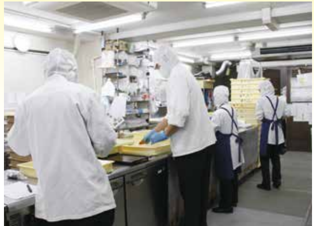
安全面に注意を払いながら調理を行うスタッフ