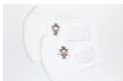
マスク(大人用・お子様用) 各¥400

練馬区内はもちろん、密かに区外からも大人気?! というねり丸のグッズ。新たに種類・デザインが増 えて好評販売中です。発売以来、大好評のねり丸マ スクやメモ帳、マグネットのほか、オリジナルグッ ズを多数取り揃えておりますので、ねりま観光案内 所と石神井観光案内所へぜひお立ち寄りください。