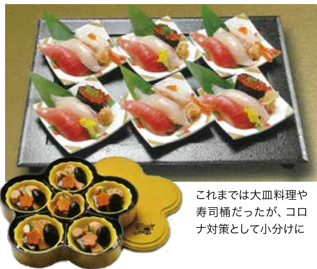
これまでは大皿料理や寿司桶だったが、コロナ対策として小分けに

「料理を美味しく召し上がっていただくためには、安心安全が必須。手間はかかりますが実直に対応し、これまでお客様からいただいた感謝を倍にして返していきたいです」